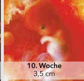
10. Woche 3,5 cm