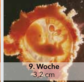
9. Woche 3,2 cm