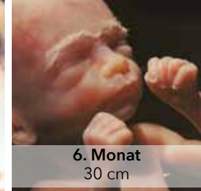
6. Monat 30 cm