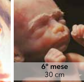
6° mese 30 cm