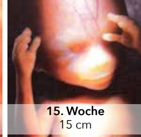
15. Woche 15 cm