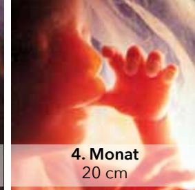
4. Monat 20 cm