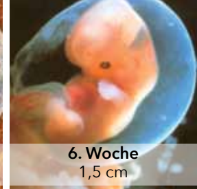
6. Woche 1,5 cm