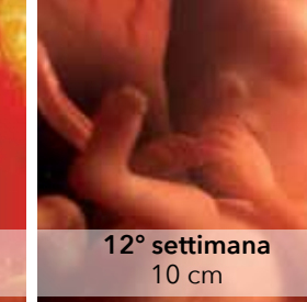
12° settimana 10 cm