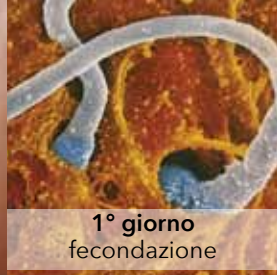
1° giorno fecondazione