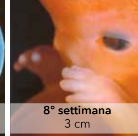
8° settimana 3 cm