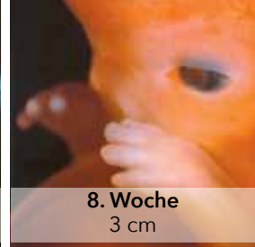
8. Woche 3 cm