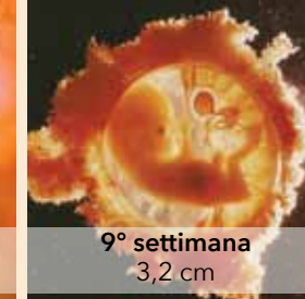
9° settimana 3,2 cm