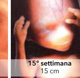
15° settimana 15 cm