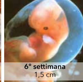
6° settimana 1,5 cm