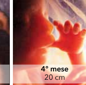
4° mese 20 cm